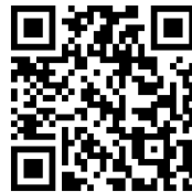
エントリーサイト

本検定の取材をご希望の場合、下記お問い合わせ記載の連絡先までご連絡のほどよろしくお願いたします。